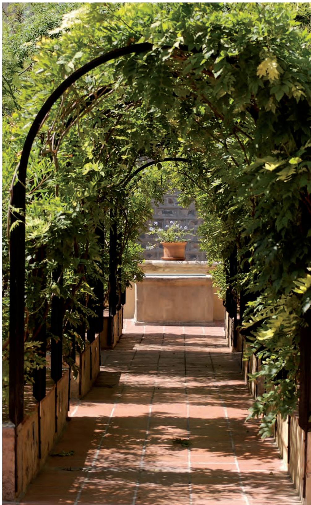
Jardí Mercè Rodoreda