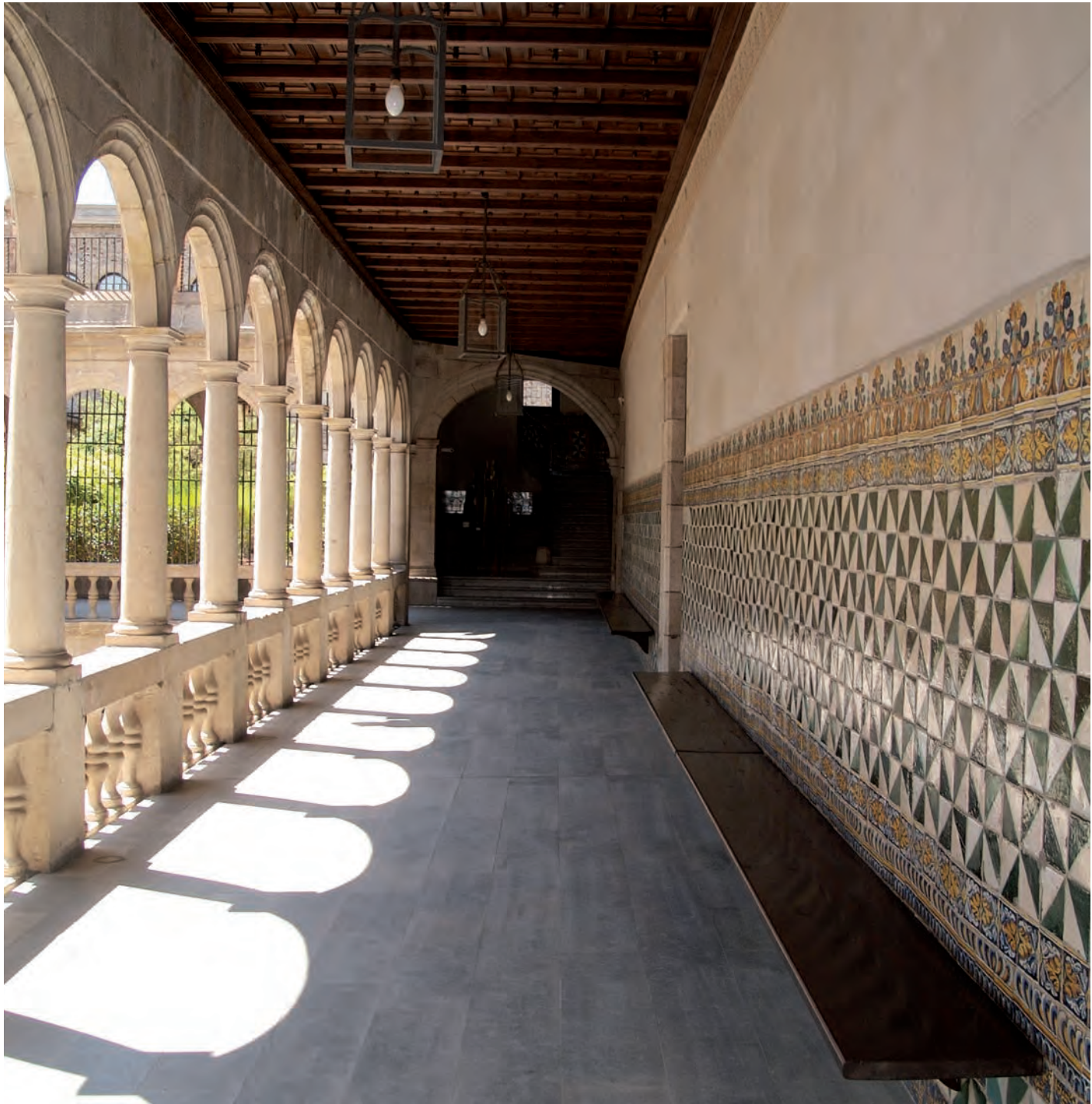
Galeria superior del pati de la Casa de Convalescència