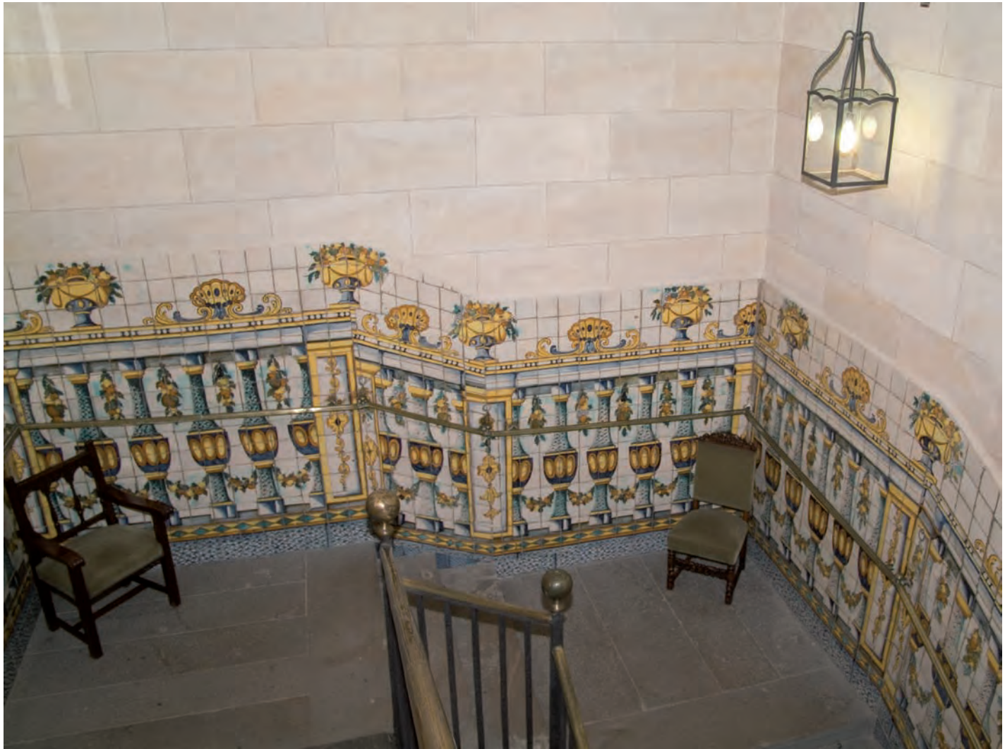
Arrambador de l'escala d'accés a la galeria superior de la Casa de Convalescència